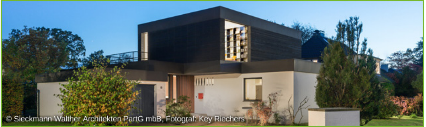
© Sieckmann Walther Architekten PartG mbB, Fotograf: Key Riechers