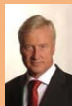
Ole von Beust Erster Bürgermeister

Ich freue mich daher, dass wir nun schon ein halbes Jahrhundert City Nord feiern können und wünsche Ihnen viel Freude bei dem Besuch der bunten Festwochen!